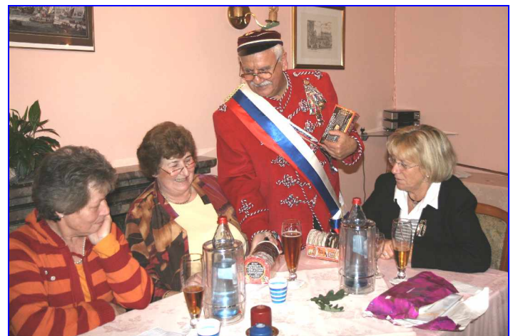
Der Mann in Rot (ein Nikolaus?) bringt süße Gaben aus Roth mit.

Stammtisch mit Damen: Später gesellte sich die Korona zu den Damen, um den neu gewählten Sprecherinnen der CD zu gratulieren.